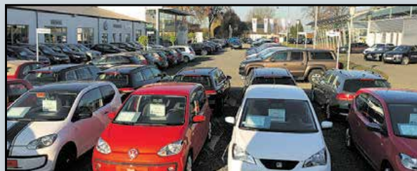
Autohaus Becher Wesel mit Jahres-, Dienst- und Gebrauchtwagen

Große Auswahl auf 5000 m 2 Ausstellungsfläche