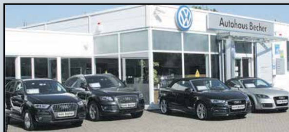
Autohaus Becher in Hamminkeln

Wenden Sie sich in allen Autofragen vertrauensvoll an uns!