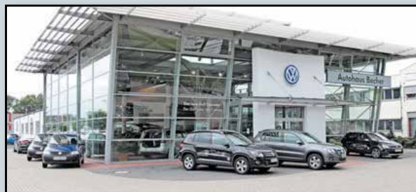
Volkswagen Forum Wesel

Große Auswahl auf 5000 m 2 Ausstellungsfläche