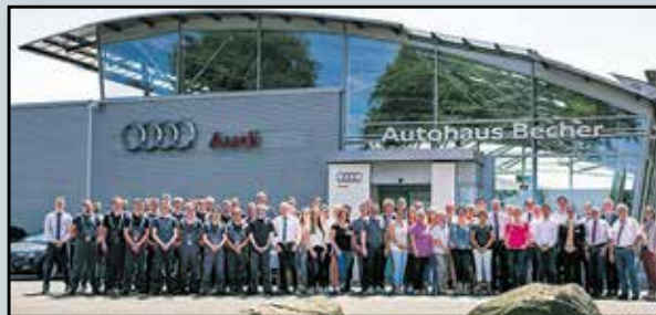
Moderne Audi Erlebniswelt Wesel