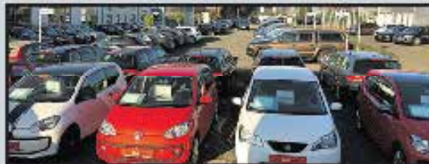
Autohaus Becher Wesel mit Jahres-, Dienst- und Gebrauchtwagen

Große Auswahl auf 5000 m 2 Ausstellungsfläche