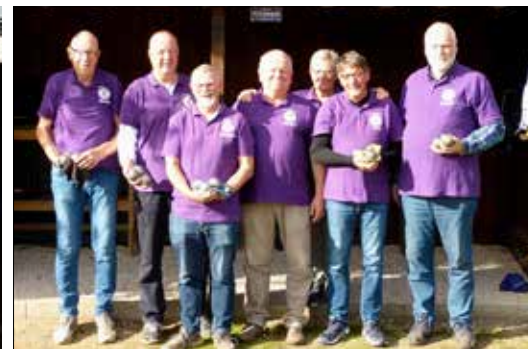
Team 1 & Team 2