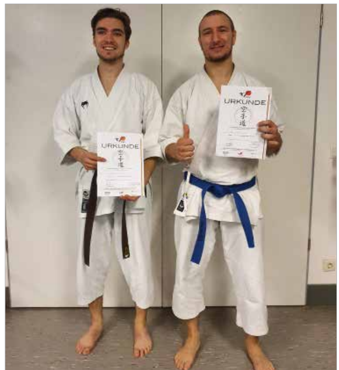
Herzlichen Glückwunsch! Es ist der Lohn für hartes und intensives Training.