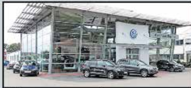
Volkswagen Forum Wesel

Große Auswahl auf 5000 m 2 Ausstellungsfläche