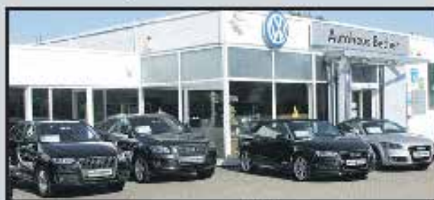
Autohaus Becher in Hamminkeln

Wenden Sie sich in allen Autofragen vertrauensvoll an uns!