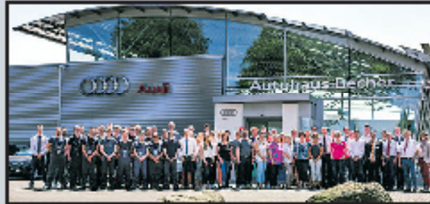
Moderne Audi Erlebniswelt Wesel